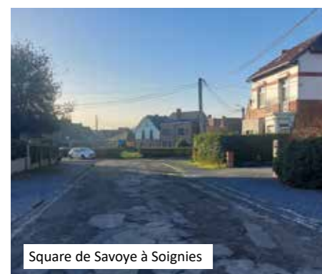
Square de Savoye à Soignies