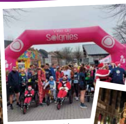
Corrida du marché de Noël