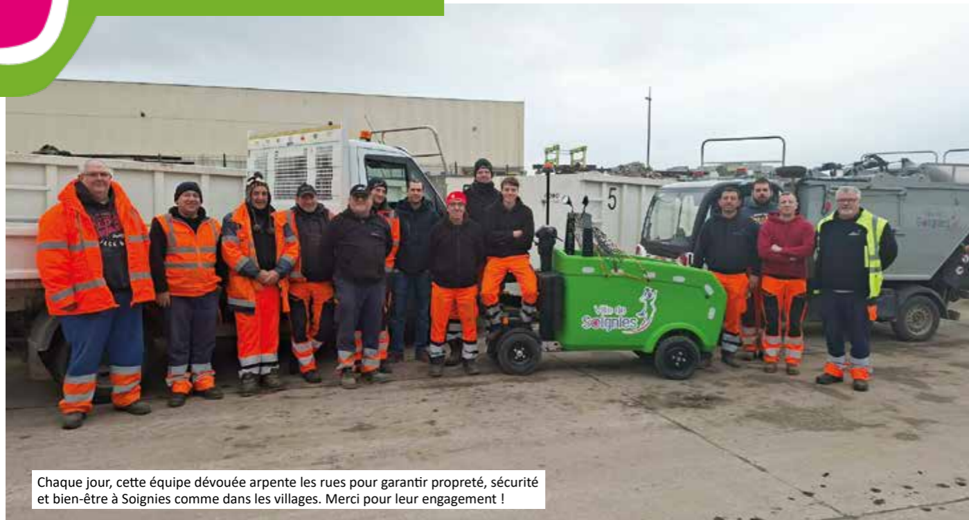
Chaque jour, cette équipe dévouée arpente les rues pour garantir propreté, sécurité et bien-être à Soignies comme dans les villages. Merci pour leur engagement !