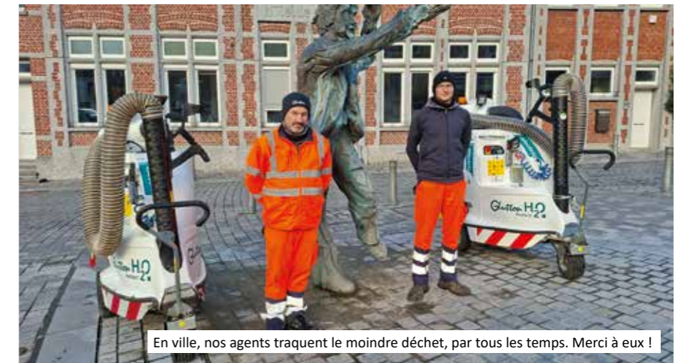
En ville, nos agents traquent le moindre déchet, par tous les temps. Merci à eux !