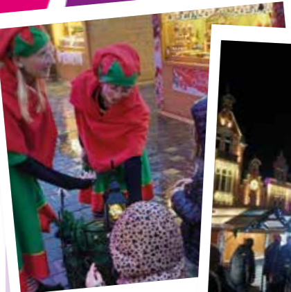
Animations sur le marché de Noël