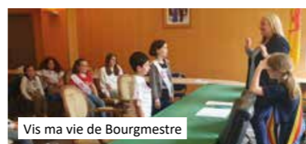
Vis ma vie de Bourgmestre