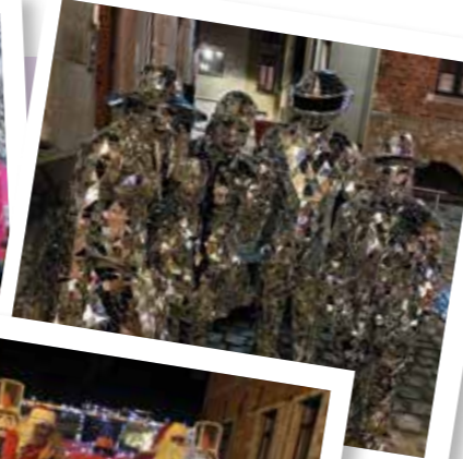
Parade de Noël