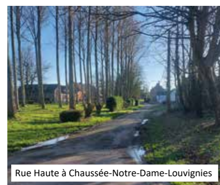
Rue Haute à Chaussée-Notre-Dame-Louvignies