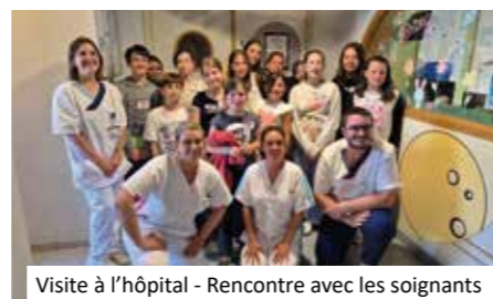
Visite à l'hôpital - Rencontre avec les soignants