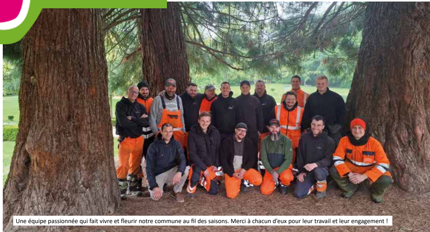
Une équipe passionnée qui fait vivre et fleurir notre commune au fil des saisons. Merci à chacun d'eux pour leur travail et leur engagement !