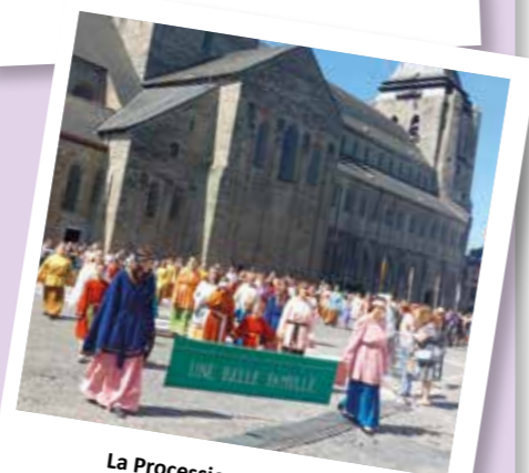
La Procession Historique