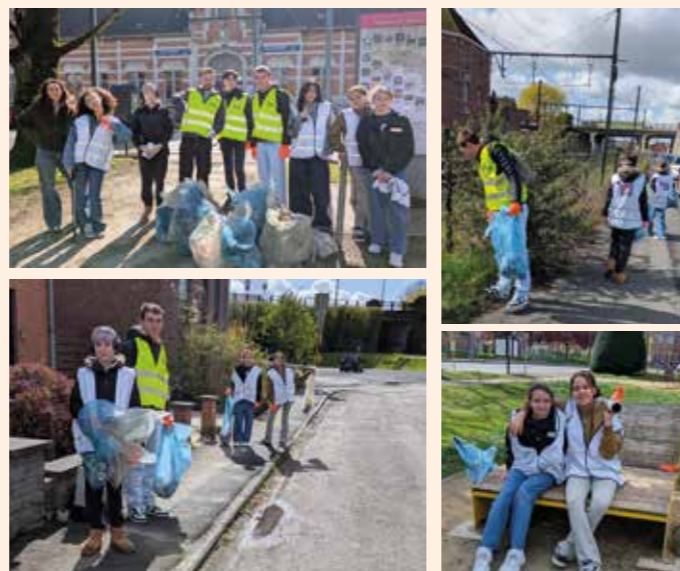
En mars, les jeunes conseillers ont participé au grand nettoyage de printemps organisé par Be Wapp, encadrés par le Service Jeunesse et le Plan de Cohésion Sociale

La Ville leur souhaite un excellent mandat placé sous le signe de l'engagement et de la participation citoyenne.