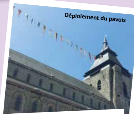
Déploiement du pavois