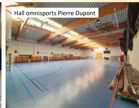
Hall omnisports Pierre Dupont