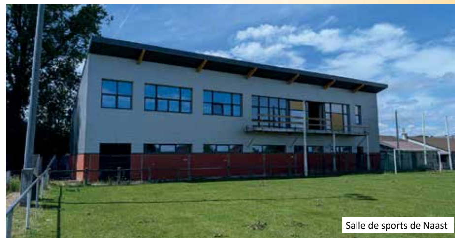
Salle de sports de Naast