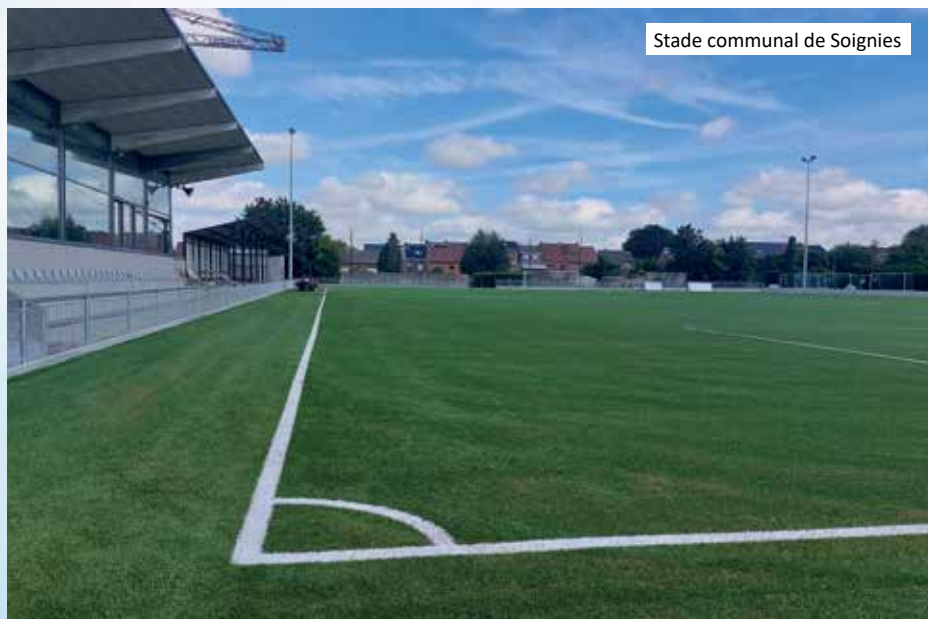
Stade communal de Soignies