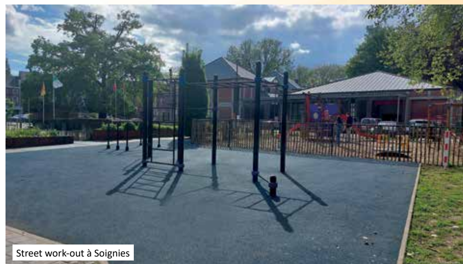
Street work-out à Soignies