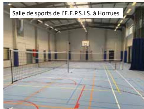
Salle de sports de l'E.E.P.S.I.S. à Horrues